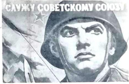
Плакаты художника В. Иванова. (Государственное издательство изобразительного искусства)