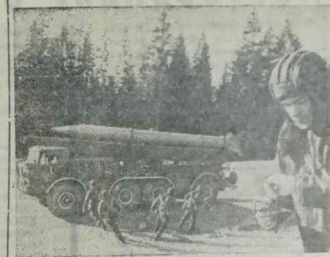
Будни Советской Армии. Проходят считанные секунды, и расчет в полной боевой готовности.