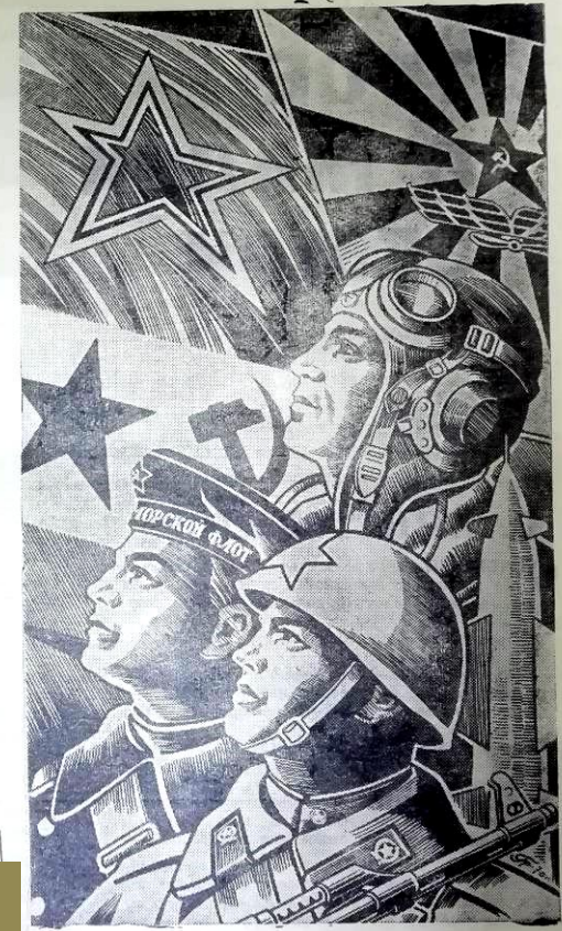
Рис. художника С. Гринько.

ПО УДАРНОМУ РАБОТАЕТ КОЛЛЕКТИВ ВОЛГОДОНСКО-