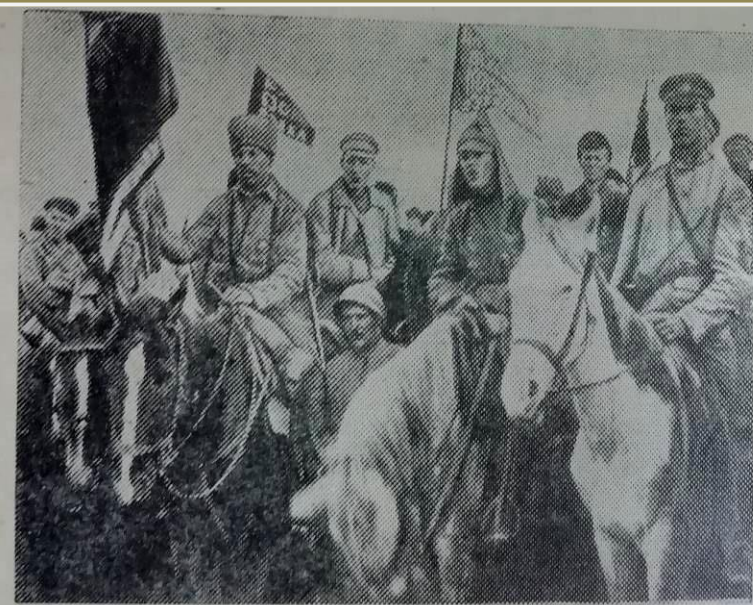
Бойцы 1-й Конной армии на митинге, 1920 год.